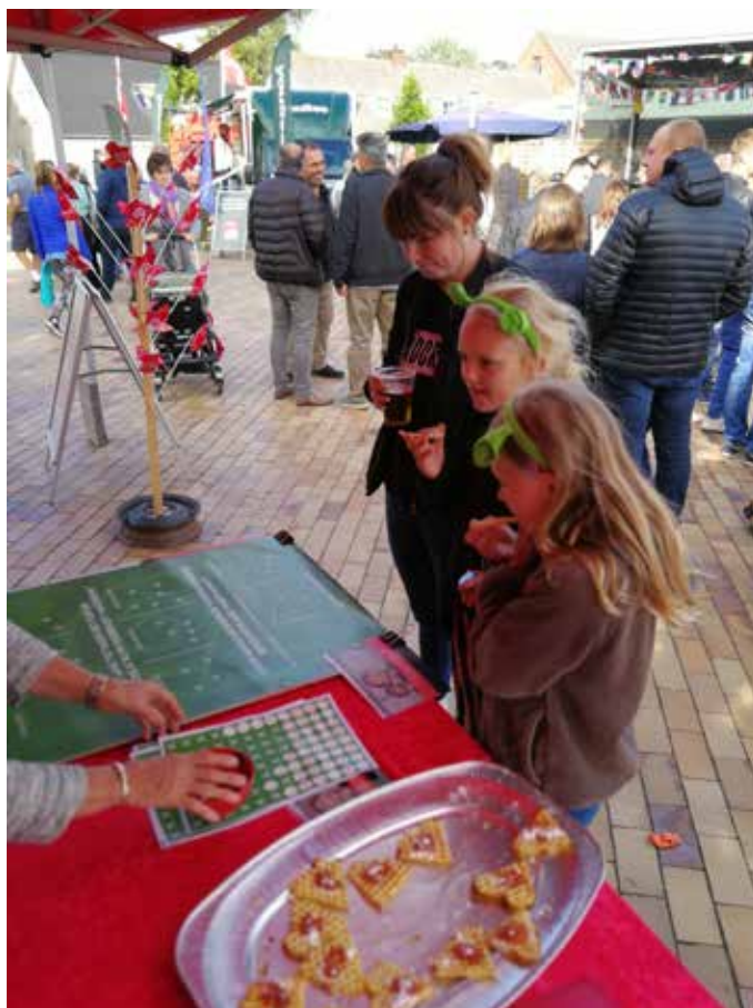
Foto fra sommer i Søndersø 2018.

efter en operation. Den store fokus har som skrevet også haft stor indflydelse på antallet af medlemmer. Mange foreninger har haft en fremgang på op til 50 %, og derfor er bestyrelserne nødt til at lytte til deres medlemmers behov for nye tiltag, hvilket der også bliver, og hvis vi i kommunen ønsker at blive sat mere på landkortet i forhold til den professionelle sportsudøver, er vi nødt til at opfylde de internationale mål på baner indenfor den enkelte sport, såvel indendørs som udendørs aktiviteter. Vi har lige afviklet en afdeling af VM i cykelcross her i vores kommune, hvilket vi skal være stolte af, og i 2021 starter Tour De France i Danmark, så vi er godt på vej til at være verdensberømte, derfor skal vi hele tiden optimere vores muligheder og ikke hvile på laurbærrene.