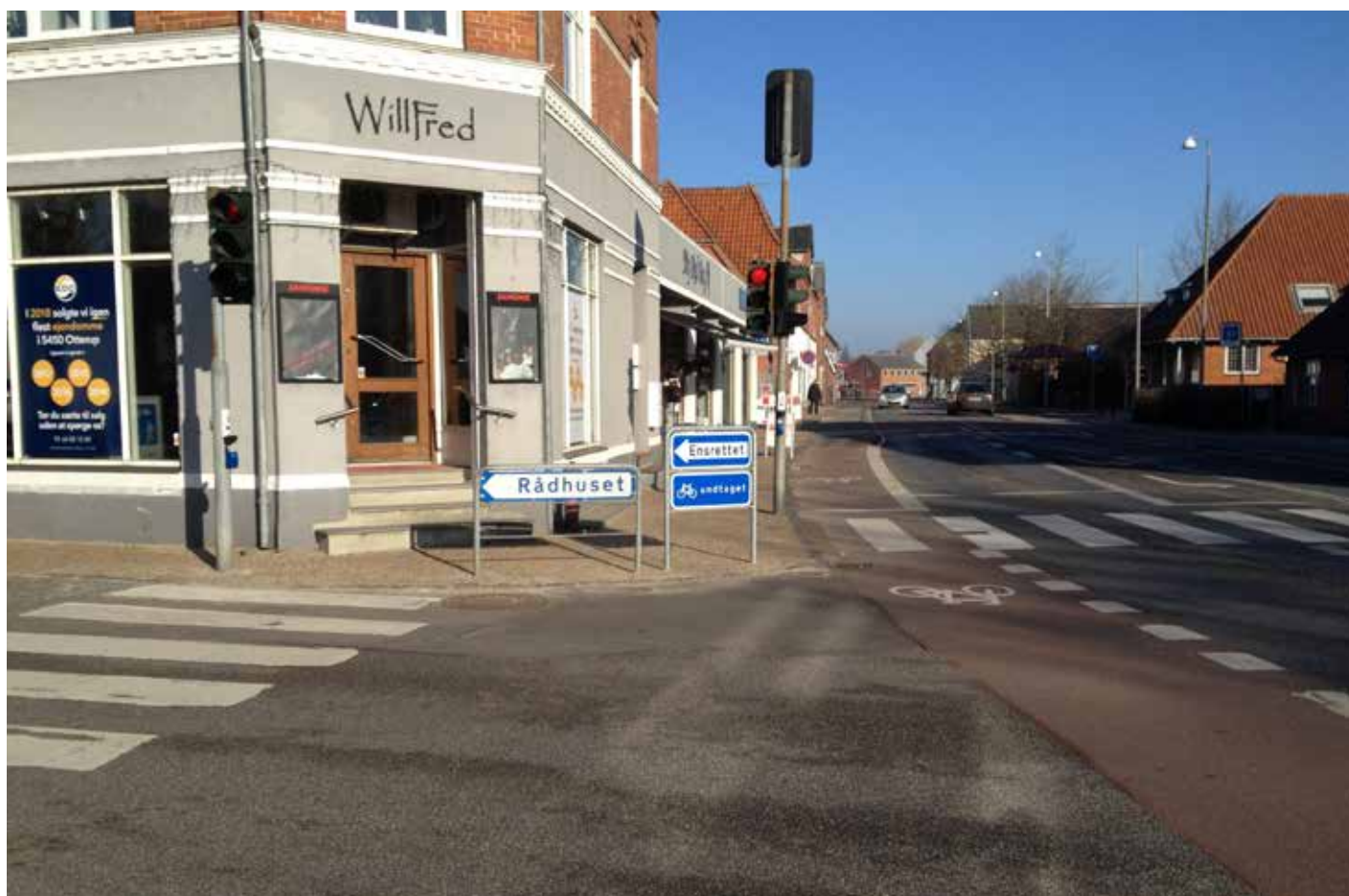
Så blev der ensretning i Otterup. Mon det nu er den rigtige retning?

I Jobcenter Nordfyn vil vi også fremover arbejde med projekter, der understøtter vores kerneopgave, supplerer vores daglige drift og kvalificerer vores arbejdsindsats. Vi nyder godt af den viden og inspiration, der følger med projekterne, så vi hele tiden kan tilbyde vores borgere den bedst mulige indsats og dermed understøtte deres fremtid på arbejdsmarkedet.