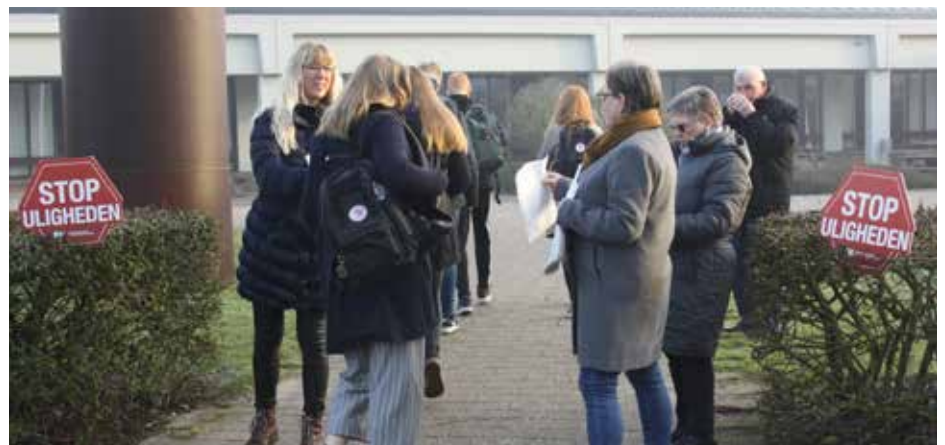
KPU (kommunalpolitisk udvalg) var på Sønder sø gymnasium en tidlig morgen med kampagnen ”Stop uligheden”. Der blev uddelt rundstykker og materialer til lærere og elever.