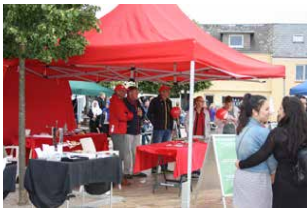
Fane fra Socialdemokratisk Forening Vigerslev.

Vi har her i sommer deltaget i det store arrangement "Sommer i Søndersø" med en stand. Der er mange stande, og det er stort set alle foreninger og forretninger m.v. der deltager. Der kommer også mange besøgende, hvis ellers vejret ikke driller for meget. Handelsstandsforeningen i Søndersø er virkelig gode til at få inviteret alle og få dem med.