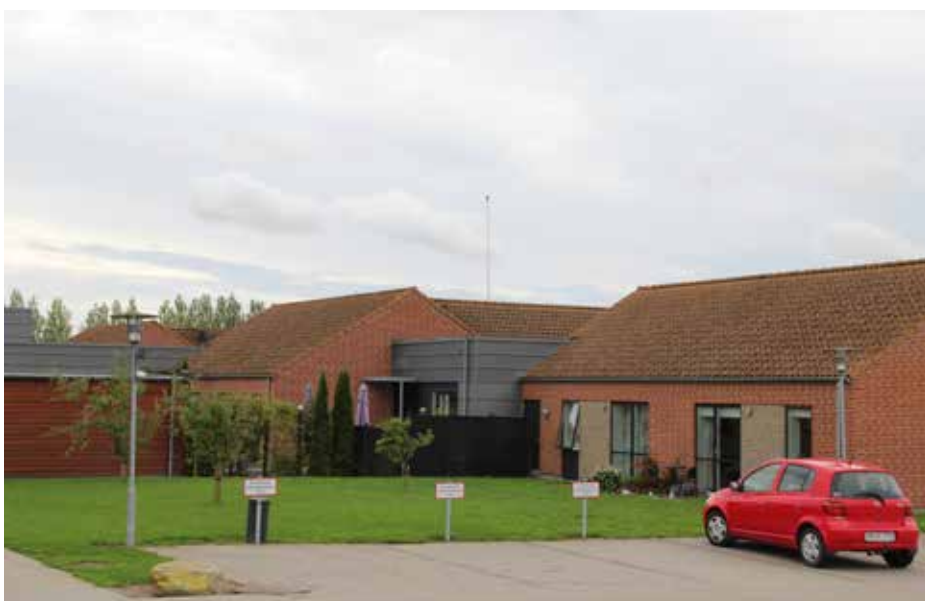
Plejehjemmet Vesterbo Søndersø.

Det bemærkes at ovenstående er til budgetbehandling til 2019, og derfor ikke er vedtaget endnu, ud over at socialudvalget har indstillet det til godkendelse.