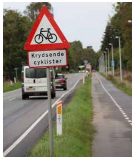
Cykelstien Morud-Søndersø.

Det vil i sagens natur ikke være muligt at tilgodese alle ønsker, men der lyttes i høj grad til meldingerne fra borgermøderne. Det er vigtigt at de lokale inddrages.