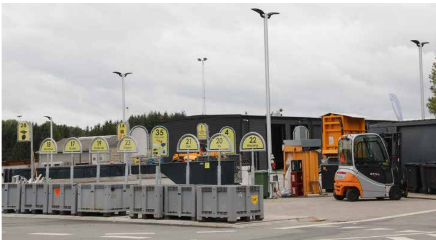
Genbrugspladsen Søndersø.

kan vi glæde os over, at netop plastik har stor brændværdi i vores varmeanlæg, fordi plastik er baseret på olie.