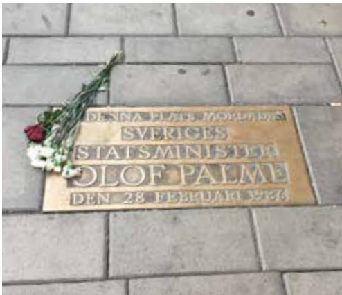
Mindepladen hvor Oluf Palme blev skudt.