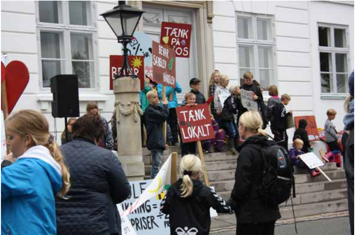
Demonstration i Bogense. Det var virkelig lykkedes at få folk op på mærkerne med det sparekatalog, der var lavet.